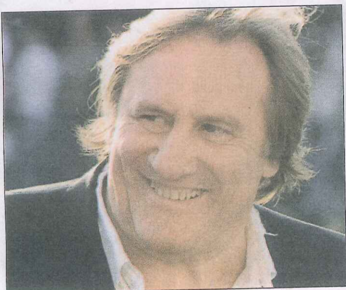
A destra la conferenza stampa della Rassegna del Cinema